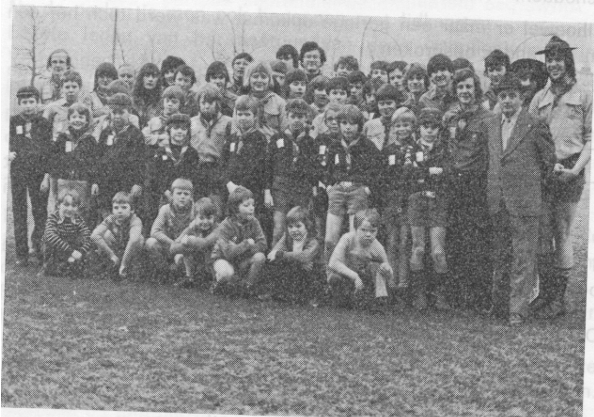
Onze scoutsgroep in 1979.